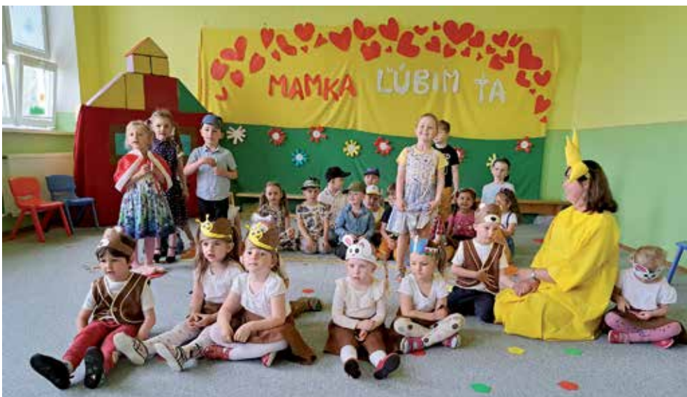
Vystúpenie deti v MŠ

Mama , slovo jemné a láskavé, slovo vo všetkých jazykoch rovnaké. „Kde bolo tam bolo, bol raz jeden domček, bývala v ňom mamička, sestrička a braček.“ Rozprávkový program v príbehu o Červenej čiapočke a modrej šiltovke deti nacvičili pre svoje mamky a babky - ženy, ktoré majú v živote každého nenahraditeľné miesto. Básňami, piesňami a tancami sme v pripravenom programe chceli k významnému Dňu matiek poďakovať všetkým mamkám za ich nehu, starostlivosť a obetavosť. Epidemiologické opatrenia sa uvoľnili a my sme konečne a s radosťou mohli po dvoch rokoch vystúpiť pred očami rodičov v budove MŠ. Všetkým mamkám, babkám prajeme pevné zdravie a veľa trpezlivosti.