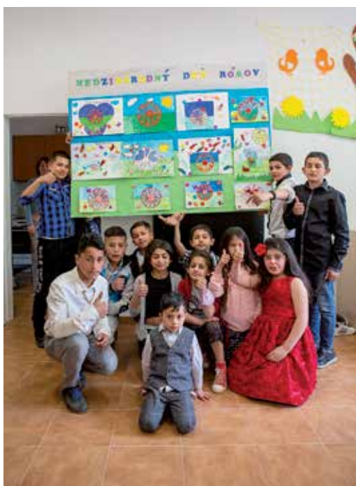
Medzinárodný deň Rómov

ciálnou základnou školou Spišský Štiavnik. Tieto aktivity smerovali k znižovaniu sociálno-patologických javov a zároveň k zvýšeniu školskej úspešnosti detí a mládeže. Komunitná rehabilitácia s cieľovými skupinami bola realizovaná v oblasti finančnej gramotnosti. Cieľom bolo správne hospodárenie s finančnými prostriedkami a aj to, ako a odkiaľ si bezpečne požičať peniaze. V rámci Klubu matiek s deťmi sa zamestnanci zamerali najmä na rozvoj jemnej motoriky detí, kognitívnych schopností a socializáciu mamičiek. Okrem toho sa v rámci pohybových aktivít organizovali loptové hry a v rámci hudobných aktivít to bolo spievanie rómskych piesní. Od začiatku výkonu KC sa zamestnancom podarilo zorganizovať štyri komunitné aktivity. Prvá z nich pod názvom „Ako si vieme navzájom pomôcť“ bola realizovaná v marci za účasti obyvateľov marginalizovanej rómskej komunity, obyvateľov obce a aj Ukrajincov žijúcich na území obce. Hlavným cieľom komunitnej aktivity bolo vzájomné prelínanie kultúr, odovzdávanie životných skúseností a eliminácia xenofóbie. Druhá aktivita sa uskutočnila 8. apríla a to pri príležitosti Medzinárodného dňa Rómov. Treťou komunitnou aktivitou bola humanitárna a potravinová zbierka. Hlavným cieľom bolo poskytnutie humanitárnej pomoci formou potravinových balíkov pre odídencov a rodiny, ktorí sú na túto pomoc odkázaní pre zlú sociálnu situáciu. 1. júna