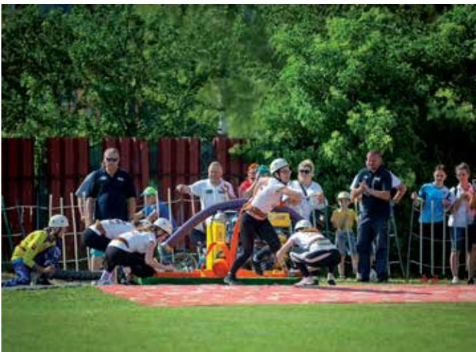
Hasičský útok

Hasičská súťaž o putovný pohár starostky obce po dvoch rokoch vynútenej prestávky zapríčinennej opatreniami pandémie COVID 19 napísala svoj ďalší ročník. V nedeľu 6.5.2022 sa v našom športovom areáli znovu zišli hasiči okresu Poprad a okolitých obcí, aby si pomerali svoju rýchlosť a šikovnosť v hasičskom súťažení. Jednou z dvoch