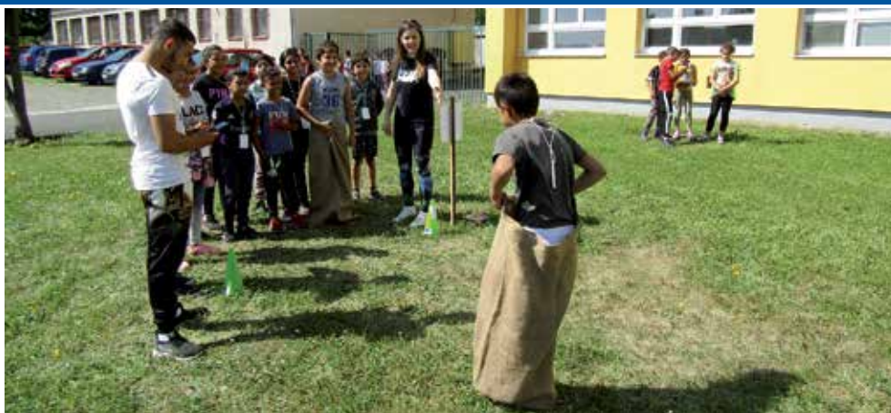
MDD v ZŠ

Tento sviatok sa oslavuje v mnohých krajinách sveta každoročne, 1. júna. Na Slovensku ho slávime od roku 1952. Myšlienka vznikla na Svetovej konferencii pre blaho detí v Ženeve, vo Švajčiarsku v roku 1925. Mnohé vlády vo svojich krajinách zaviedli tento deň s cieľom urobiť deťom radosť a tiež poukázať na problémy týkajúce sa detí na celom svete. V tento deň by mali deti mať veľkú oslavu. Tak sme sa aj my v základnej škole rozhodli osláviť tento deň športovými a zábavnými aktivitami. Tohto roku sme kvôli počasiu oslavovali až 3. júna, ale stálo to za to. Deti sa veľmi tešili a po spoločnom nástupe sa postupne zúčastňovali na všetkých disciplínach. Veľkými pomocníkmi boli starší žiaci, ôsmaci, ktorí sa na chvíľu stali veliteľmi družstiev a sprevádzali deti ku každej disciplíne. Deti si zabehli 50 metrov, skákali vo vreciach, chytali rybky v rybníku, hádzali do basketbalového koša, snažili sa zhodit' čo najviac plechoviek a triafali loptičky do dreveného šaša. Každý účastník mal na krku kartičku, do ktorej sa zapisovali jeho úspechy. Po splnení všetkých disciplín si každá trieda vyhodnotila svojich najlepších a najšikovnejších súťažiacich, ktorí boli odmenení čokoládovými medailami. Všetky deti dostali sladkú cukríkovú odmenu a potom už nesúťažne skákali cez švihadlo a hrali futbal.