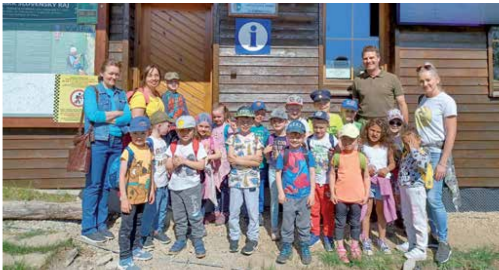
Deti v Slovenskom raji

V mesiaci apríl zavítala do našej materskej školy ochránarka Janka z Českého raja, ktorá deťom prostredníctvom prednášky priblížila tému - OCHRANA PRÍRODY. Dozvedeli sa, aké máme „Safari za domovom“, vyrobili si domček pre ježka a hotel pre hmyz. Rozprávali sa o divočine v lese, ako sa postarať v zime o zvieratá, no aj o znečisťovanie prírody človekom, dnes veľmi aktuálnej problematike. Dôležité zo strany učiteľov i rodičov je podnecovať deti k empatickému správaniu voči živej i neživej prírode, voči svojmu okoliu a k samým sebe. Malými krokmi dokážeme veľké veci. V závere si deti zasúťažili o pekné ceny a na počesť Dňa Zeme vyzbierali v okolí MŠ odpadky.