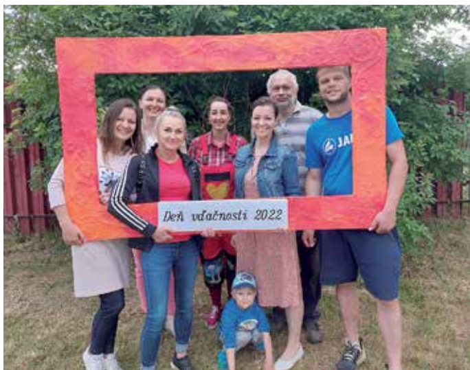
Deň vďačnosti 2022

V dnešnej uponáhľanej dobe nie je nič dôležitejšie ako čas, ktorý strávime so svojou rodinou, blízkymi a priateľmi. Všetci sme si prežili obdobie odlúčenia, izolácie, strachu z choroby, ktorá ochromila svet. Chýbali nám priatelia, spoločnosť, akcie, na ktorých sa ľudia dovtedy pravidelne a radi stretávali.