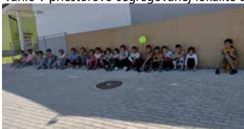
Loptové hry

Komunitné centrum Spišský Štiavnik (KC) v rámci Národného projektu Komunitné služby v mestách a obciach s prítomnosťou marginalizovaných rómskych komunit – II. fáza začalo výkon činnosti od 1. decembra 2021. Poskytovanie sociálnych služieb v KC sa riadi zákonom o sociálnych službách. V KC sa poskytujú sociálne služby, vykonávajú aktivity a zabezpečujú činnosti v zmysle § 24d zákona o sociálnych službách pre celú komunitu a taktiež pre občanov v nepriaznivej sociálnej situácii, ktorí sú ohrození sociálnym vylúčením, majú obmedzené schopnosti a možnosti sa spoločensky začleniť a samostatne riešiť svoje problémy pre zotrvanie v priestorovo segregovanej lokalite a