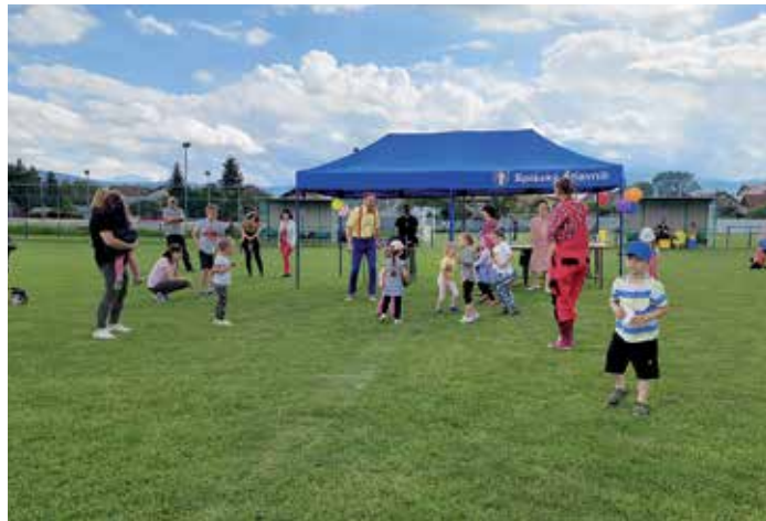
Deň vďačnosti 2022