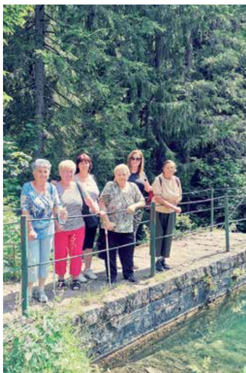
Výlet v Slovenskom raji

V začínajúcom letnom období terénny sociálny pracovník (TSP) a terénni pracovníci (TP) zorganizovali výlet so seniormi, kde sa vybrali na prechádzku krásnou prírodou v Slovenskom raji na náučný chodník v doline Blajzloch. Trasa bola nenáročná, seniory ju vynikajúco zvládli a užívali si okolité krásy prírody. Po prechádzke dolinou sa presunuli na Podlesok, kde si vychutnali výborný obed a posedeli pri kávičke. Výlet so seniormi sa niesol v duchu spokojnosti, radosti, vzájomnej komunikácie a získavania nových zážitkov. Deň, ktorý TSP a TP strávili so seniormi bol pre nich vynikajúcou skúsenosťou a obohacujúcim zážitkom, tak prispeli k peknému dňu seniorom. Dojmy účastníkov výletu z tohto dňa boli príjemné. Aj takto TSP a TP dokázali našim starším spoluobčanom spríjemniť všedný deň.