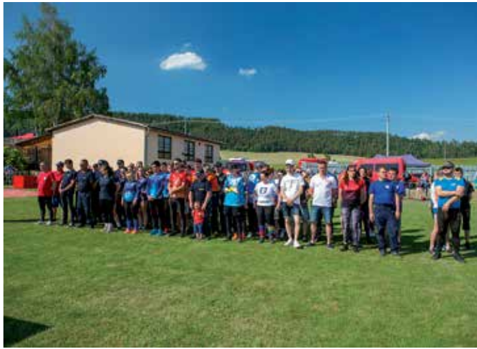
Slávnostný nástup

novinkou tohto ročníka bolo prvé kolo Tatranskej fajermanskej ligy v požiarom útoku s vodou, ktorú sa rozhodli organizovať činovníci DHZ okresu Poprad s cieľom postupu do vyšších súťaží. Najlepším družstvom medzi mužmi sa stalo Spišské Bystré pred Spišskou Sobotou a Gánovcami. U žien prvenstvo patrilo Spišskej Sobote pred Hranovnicou a Gánovcami.