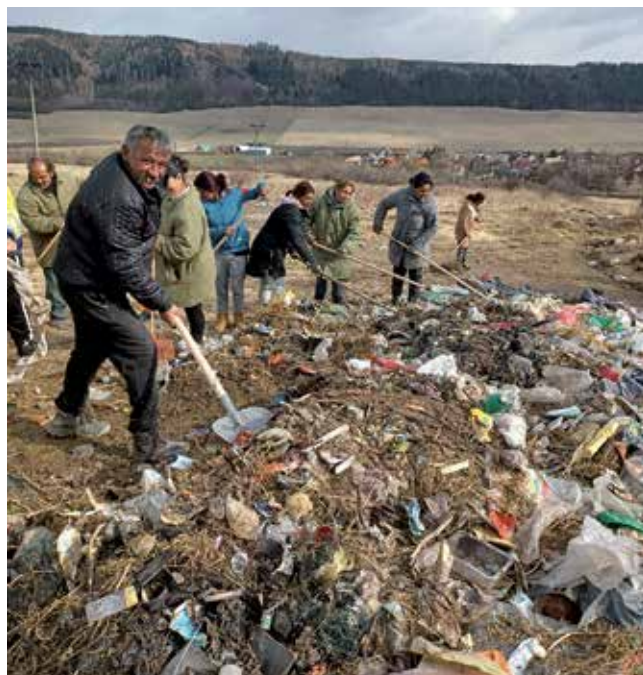
Upratovanie odpadu