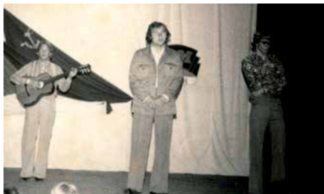
Ticho zvonja ovce na rozlúčku, 1974, divadielko NOVUS – víťaz celoslovenskej prehliadky záujmovej umeleckej činnosti dedinskej mládeže v Dedine Mládeže roku 1974

v súbehu viacerých nepriaznivých okolností, ktoré objektívne po páde vtedajšieho politického režimu v spoločnosti nastali. Bol to predovšetkým masívny nástup obrazových médií (po roku 1989 i zahraničných), úbytok divadelných