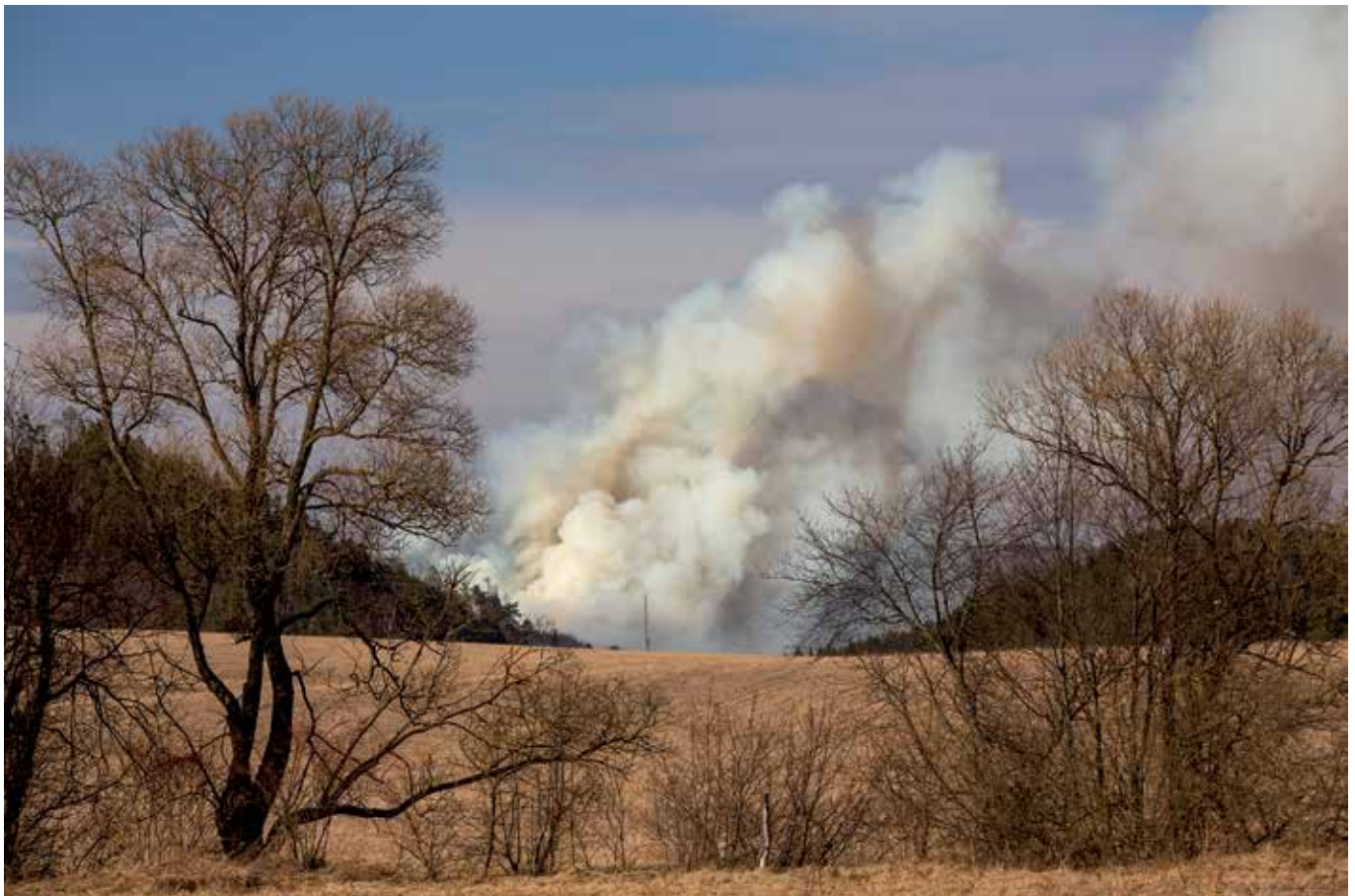
Požiar lesa v obci Hôrka