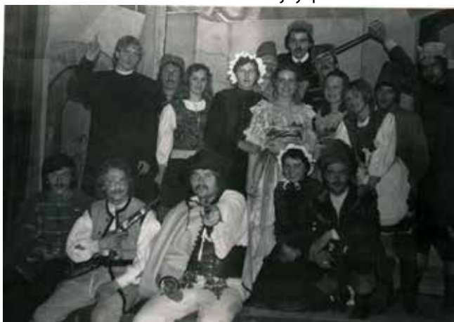
Jonáš Záborský: Báthoryčka, 1975.