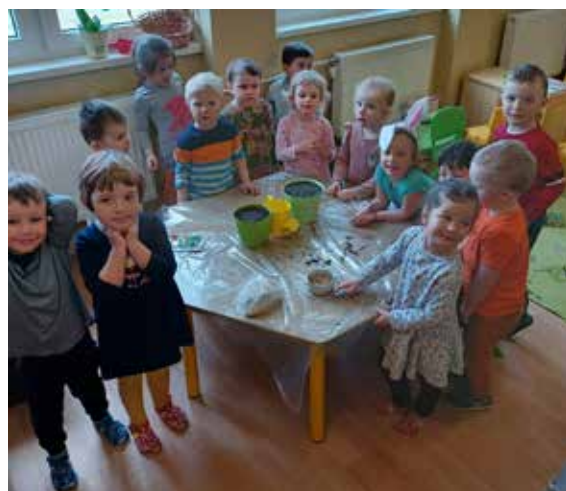
Deti pri aktivitách

Každoročné prípravy na Veľkú Noc prežívame symbolicky s jarnou náladou. Príroda sa prebúda, na zasnených stromoch badať prvé púčiky a kvety, zubaté slnko silnejšie hreje a svieti, a konečne môžu byť do sýtosti von i naše deti. Jar je charakteristická sadením. S našimi škôlkarmi sme si pripravili aktivitu: Sadenie jačmeňa.