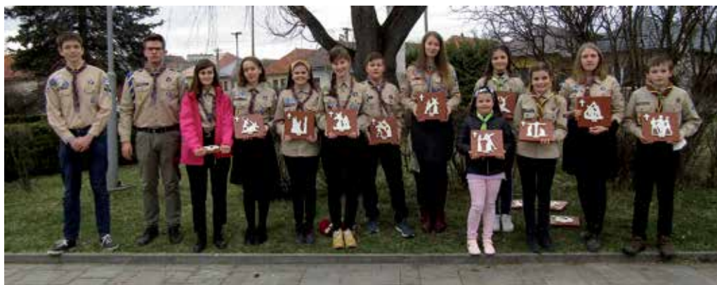
Križová cesta v obci