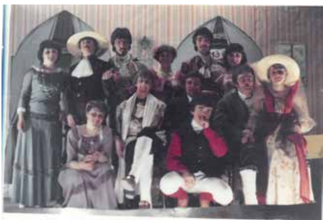
Carlo Goldoni: Sluha dvoch pánov, 1980– 1981