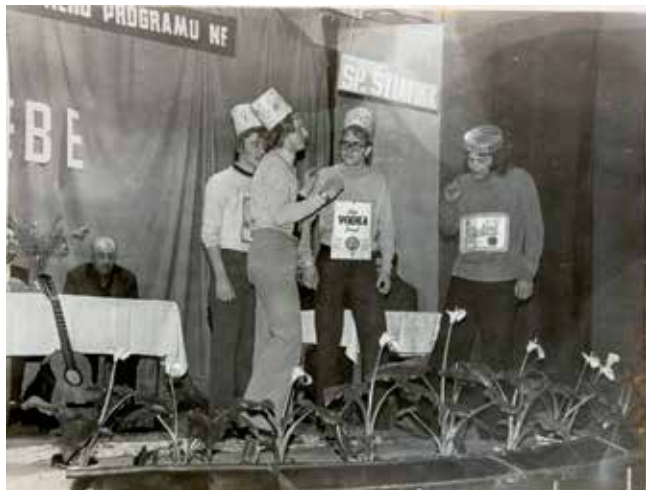
Alkohol, 1972, divadielko NOVUS