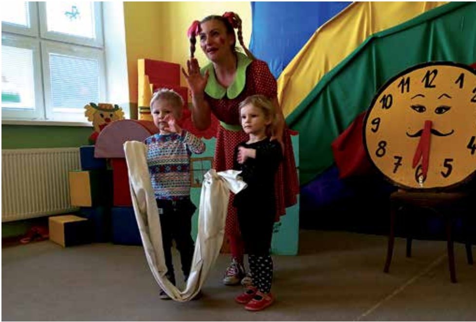
Herečka s deťmi

Prvý jarný mesiac - Marec - je mesiac spojený s KNIHAMÍ. V rámci tohto mesiaca sme navštívili konečne po dvoch rokoch Obecnú knižnicu v Spišskom Štiavniku (v súvislosti s uvoľnením opatrení Covid-19). Vytvorili sme si rozprávkový týždeň a ako prekvapenie, k nám prišlo 7. marca Divadlo na predmestí zo Spišskej Novej Vsi. Predstavenie bolo o rozprávkovom príbehu o dvoch sestrách Botkových – Danke a Janke. Sestry, dvojčičky, ktoré sú úplne rovnaké, mali so sebou aj svojho brata Miška. Veselými príhodami, piesňami a hravými rekvizitami vtiahli deti do humorného deja a svojich dobrodružstiev. V priestoroch sa ozývali smiech a radosť. Prvú knihu Danka a Janka deti zobrali do rúk už v roku 1961. Kniha už vo svojich začiatkoch získala Cenu vydavateľstva Mladé letá. Táto kniha by mala byť v každej detskej knižnici ako klenot.