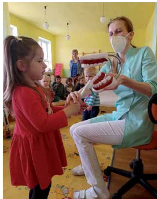
Správne čistenie zúbkov

Ďalej je už len potrebný čas na rast baktérií a zubný kaz je na svete. Okrem bolesti zubov u detí spôsobujú zubné kazy vo väčšine prípadov aj traumatickú návštevu u stomatológa. Dá sa týmto problémom predísť? Do našej materskej školy sme sa rozhodli zavolať dentálnu hygieničku. Vo svojej práci sa venuje primárne deťom a podelila sa s nami o svoje skúsenosti a rady z praxe. Okrem správnej techniky čistenia zubov je potrebné zvoliť správnu zubnú kefku, ktorá eliminuje riziko poranenia ďasien a zvyšuje efektivitu vyčistenia zubov. Špeciálne typy zubných kefiek majú hlavice a štetiny prispôbosené ústnej dutine tak, aby odstránili čo najväčšie množstvo baktérií - „zubožrútov“. Pri čistení zubov nezáleží na čase, ale kvalite, dôkladnosti a vytrvalosti čistenia. Z tohto dôvodu je pri čistení zubov u detí potrebná dôsledná pomoc rodičov. Pripravenými pomôckami mali deti možnosť skúsiť vyčistiť veľkú maketu zubov, prezreli si sadu dentálnych nástrojov a mali názornú ukážku priebehu návštevy dentálnej hygieny. Následne si všetci spoločne vyčistili zuby pod jej odborným dohľadom. Deti boli zaujaté a aktívne. Návšteva sa im veľmi páčila. Mamky a ockovia, pravidelne a dôsledne dbajte o ústnu dutinu vašich detí. Zdravým zúbkom zdar!