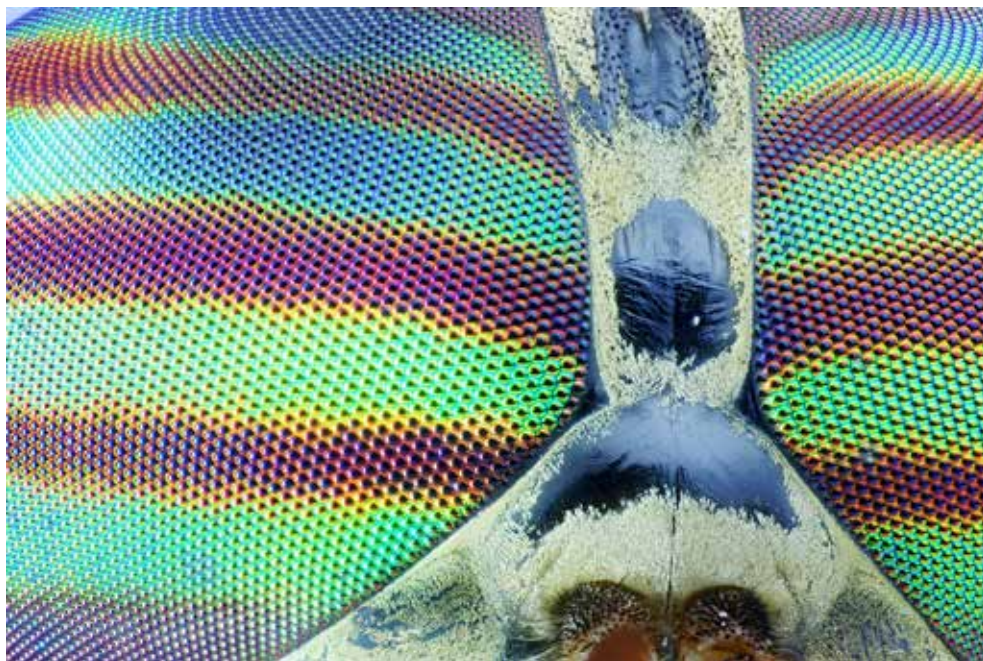
Fotohádanka