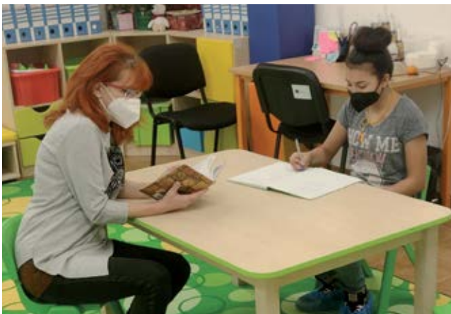
Aktivita v Komunitnom centre

Komunitné centrum Spišský Štiavnik (KC) sa nachádza na adrese Slnčná 532/5A v Spišskom Štiavniku. Ide o inštitucionálne zariadenie, ktoré poskytuje primárne programy reagujúce na aktuálne problémy a potreby miestnej komunity. Komunitné centrum definuje zákon č. 448/2008 Z. z. o sociálnych službách v znení neskorších predpisov ako sociálne služby krízovej intervencie. V KC sa podľa citovaného zákona fyzickej osobe v nepriaznivej sociálnej situácii poskytuje základné sociálne poradenstvo, pomoc pri uplatňovaní práv a právom chránených záujmov, pomoc pri príprave na školské vyučovanie a sprevádzanie dieťaťa do a zo školského zariadenia, vykonáva preventívna aktivita a zabezpečuje záujmovú činnosť. Nesmiernou dôležitou úlohou v KC je i realizácia sociálnej a komunitnej rehabilitácie. Ich cieľom je zabezpečiť podporu samostatnosti, rozvoj komunikačných zručností, podporu sociálnych aktivít a tak pomôcť ľuďom, aby sa stali aktívnymi a rovnocennými členmi svojich komunit. Do registra poskytovateľov bolo KC zapísané 17. augusta 2021 a následne sa zapojilo do Národného projektu Komunitné služby v mestách a obciach s prítomnosťou marginalizovaných rómskych komunit – II. Fáza (NP KS MRK) financovaného z prostriedkov Európskeho sociálneho fondu v rámci Operačného programu Ľudské zdroje Prioritná os 5. Integrácia marginalizovaných rómskych komunit. V rámci NP KS MRK začalo Komunitné centrum výkon činnosti dňa 1. decembra 2021. Hlavným cieľom je poskytovanie komplexných sociálnych