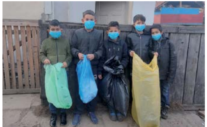
Aktivita v Komunitnom centre