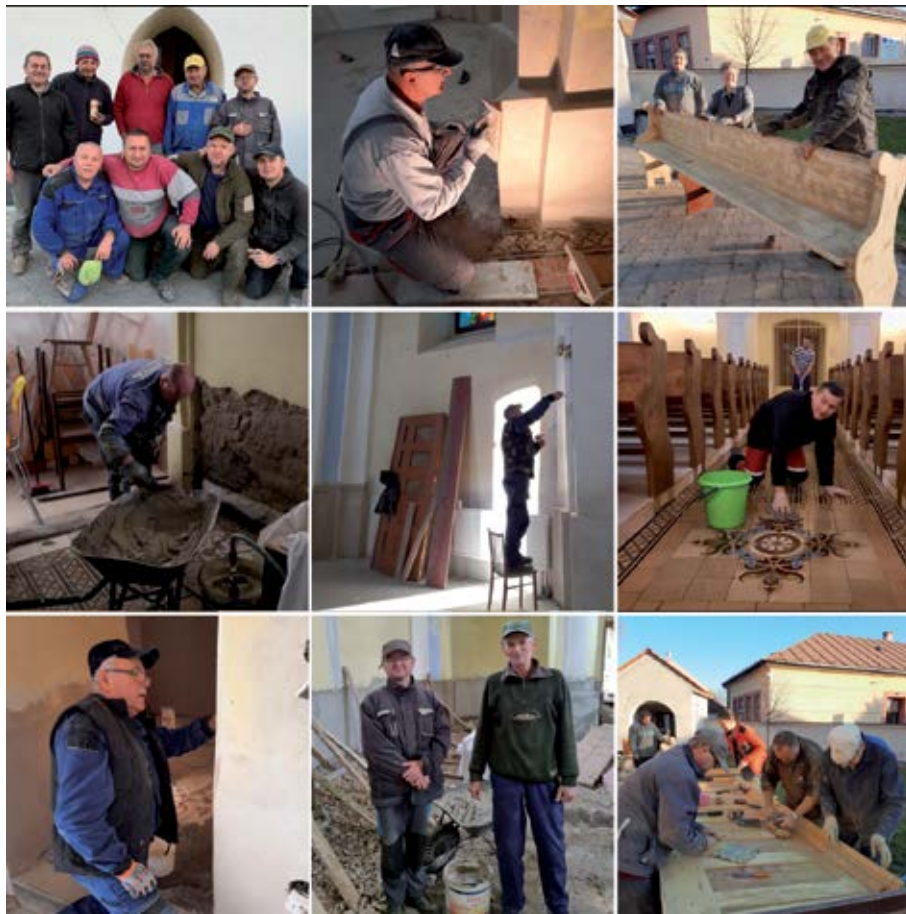
Práce na rekonštrukcii kostola

boli hore na klenbách kostola a niečo z vyše dvojmetrových hĺbok ramien klenby vyberali kamene, prach, šindle a iné, či to nejakou dierou neťahajú aj zo spodku kostola. Počas sobotňajších brigád sme naplnili tri plné kontajnery a jedno nákladné auto stavebného odpadu, ktorý sa počas stáročí nahromadil a ktorý nikto do jesene roku 2021 neriešil. Až zateplenie klenby prinieslo túto nadľudskú výzvu. Po tejto činnosti človek vyzeral, akoby bol vyšiel z bane. Len oči nám svietili... Mnoho manželiek, pri návrate svojich manželov domov, ich vôbec nespoznávalo... Istotne, nielen po tejto činnosti, človeku dobre padlo občerstvenie výborným obedom a inými dobrotami, ktoré nám pripravili šikovné gazdinky. Aj touto cestou chcem za všetky ich dobré a drobné podakovať. Pri tejto príležitosti by som rád spomenul jednu úsmevnú situáciu pri večeri - rezne a šalát, pri ktorom nám ostal