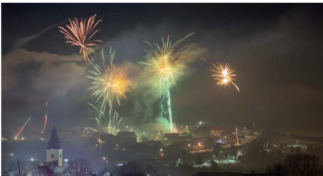
Silvestrovský ohňostroj