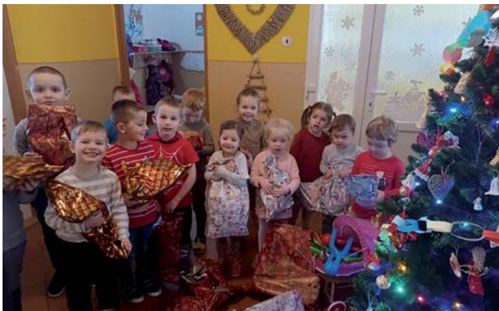
Vianočná atmosféra v MŠ