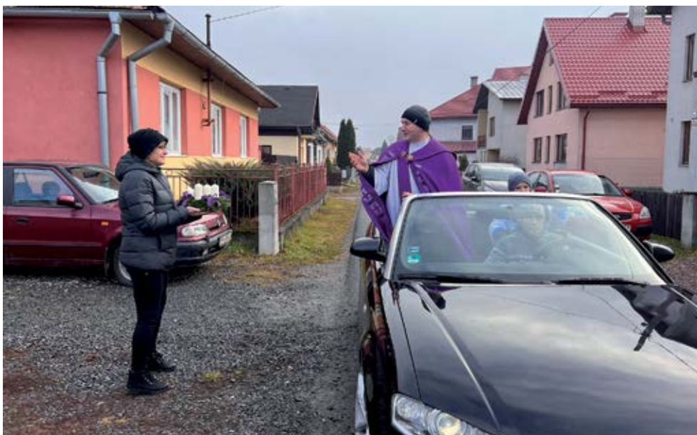
Požehnanie adventných vencov