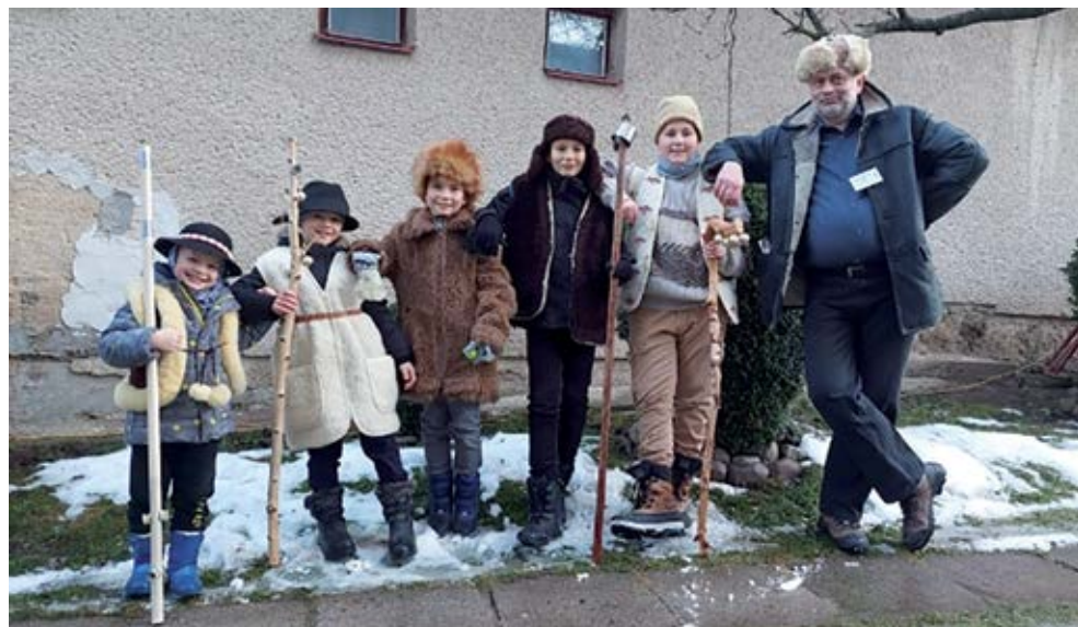
Koledníci v uliciach Sp. Štiavnika