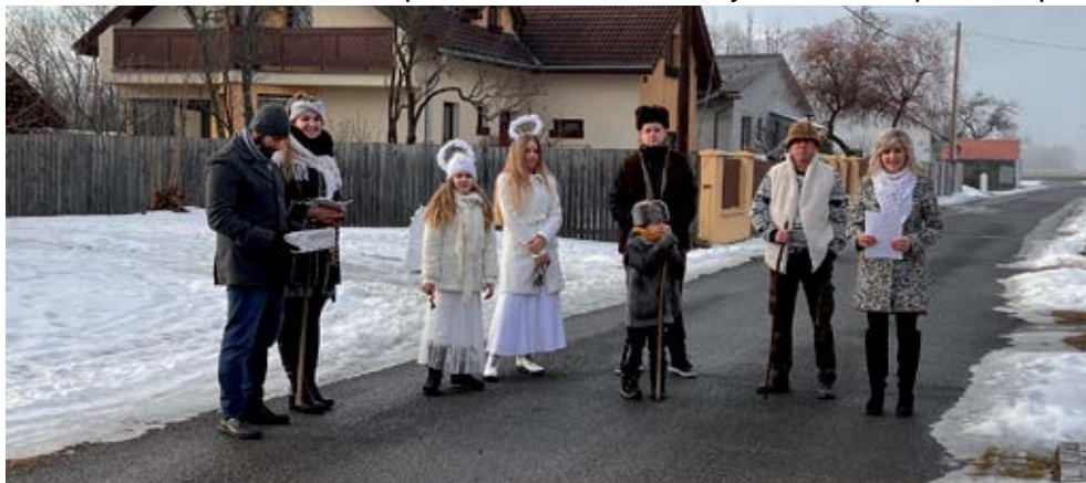
Koledníci v uliciach Sp. Štiavnika

peniaze poputujú do Afriky na podporu rôznych projektov. Nie sú určené „na spotrebu“, ale „na investíciu“. Idú konkrétnym ľuďom na konkrétny účel. Prevažne na podporu začínajúceho podnikania: pre krajčírky, včelárov a podobne. Podpora pre jedného človeka začína vo výške niekde okolo päťsto eur. Na Slovensku je to pre jednu rodinu, dajme tomu, na mesiac. V Afrike to konkrétnej rodine môže pozitívne zmeniť osud na dlhé desaťročia. Samozrejme, ak sa tie peniaze správ-