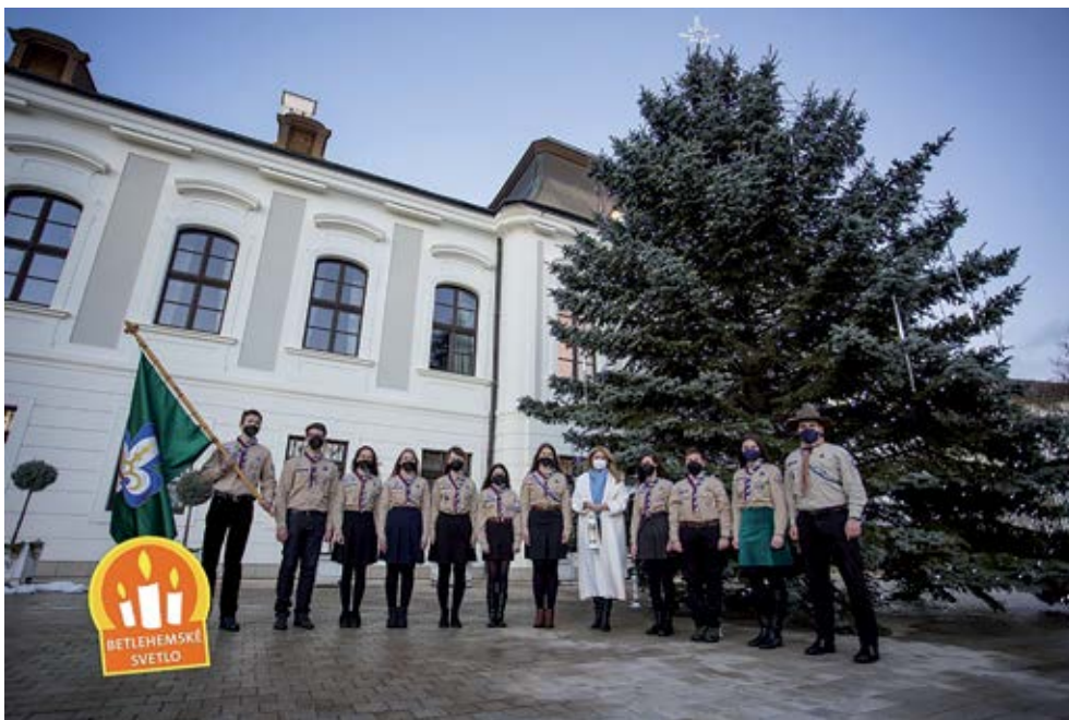
Štiavnickí skauti pri pani prezidentke

Tohto roku bolo ešte symbolickejšie a ešte vzácnejšie, ako doteraz.