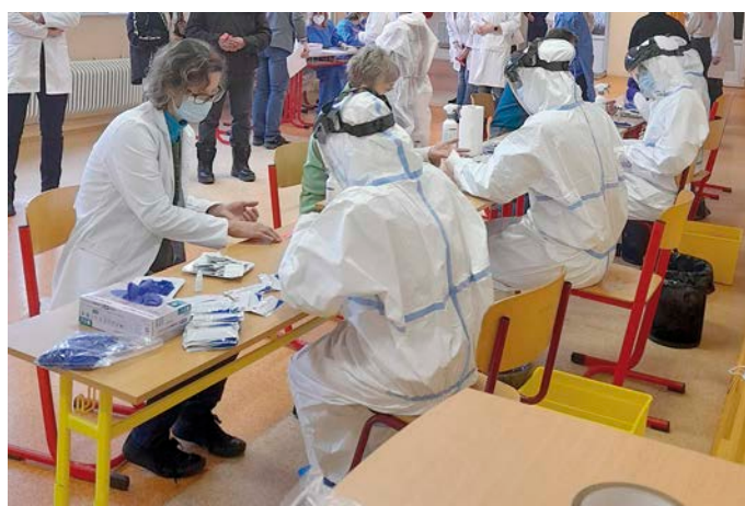
Pilotné testovanie