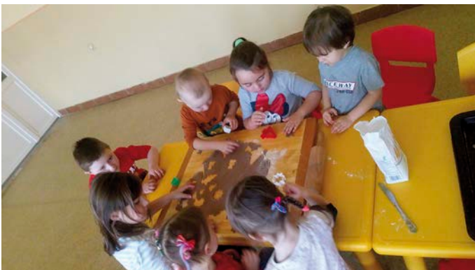
Pečenie medovníčkov