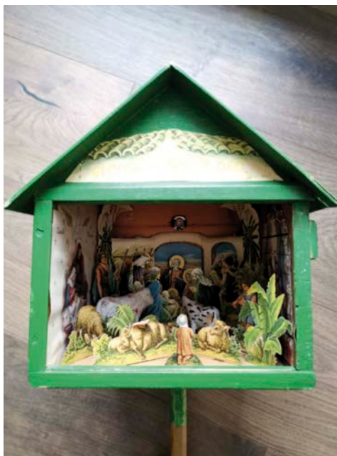
Hviezda zo Sp. Štiavniku (Autor foto: G.Ch.)

Zdroje: www.ludovakultura.sk www.dobranovina.sk