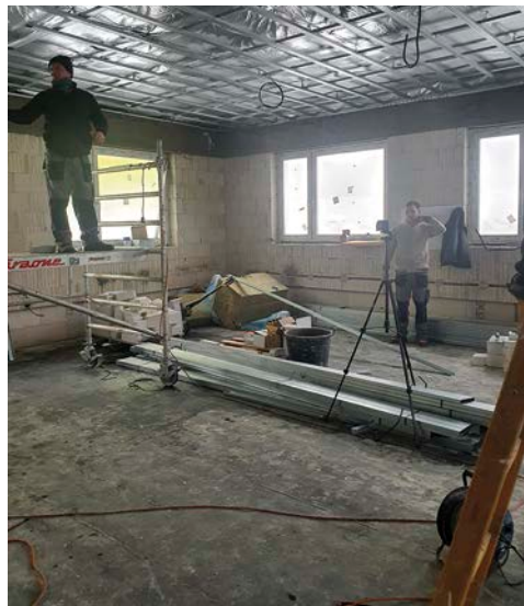
Výstavba komunitného centra