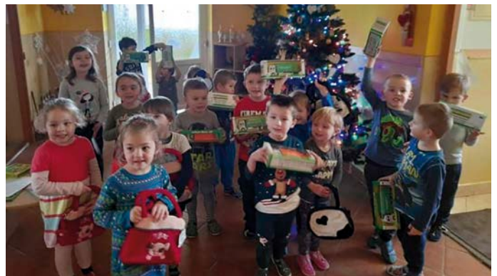
Deti pri stromčeku