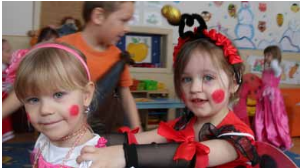
Karneval v MŠ