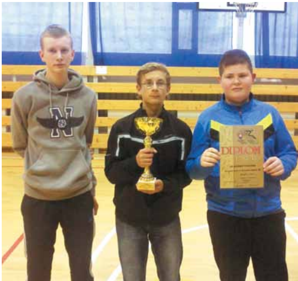
Krajské kolo v stolnom tenise