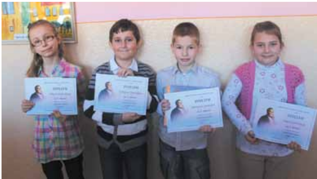
Naši recitátori na školskom kole