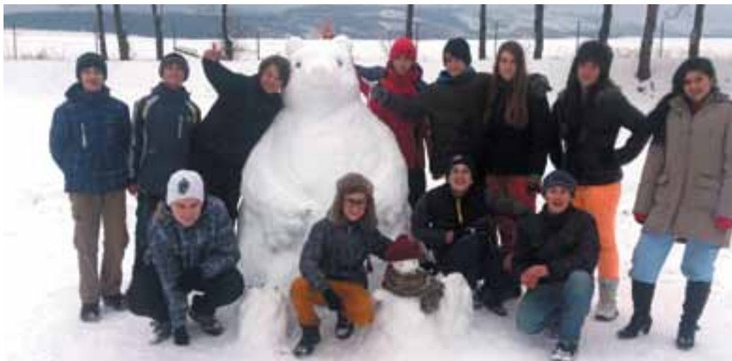
Snežné sochy, 8.A

Fotografie k článku - Škola telegraficky: Sochy zo snehu (strana 4)