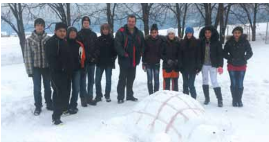
Snežné sochy, 9.A (foto archív ZŠ)