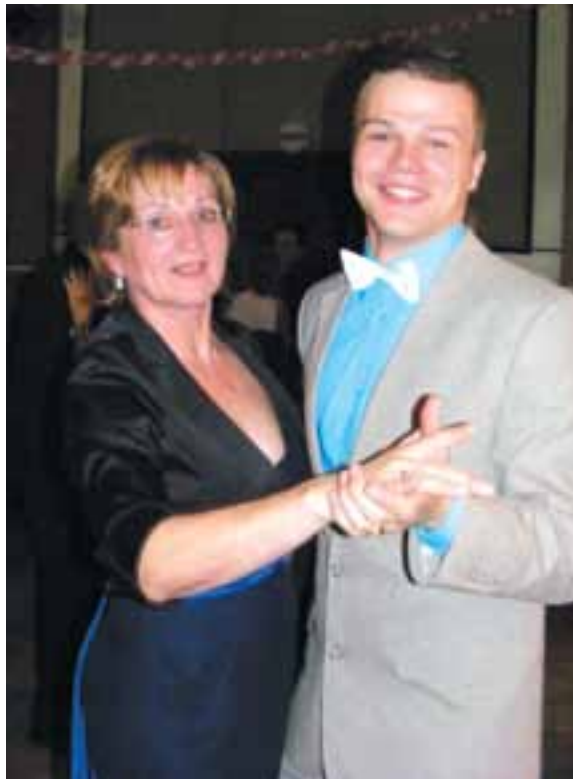
Štiavnický ples

Fašiangy, Turíce, Veľká noc ide, kto nemá kožuška zima mu bude.