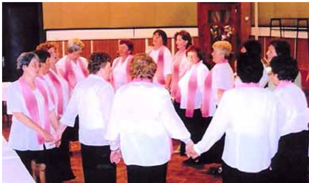
Ako prežili fašiangy dôchodcovia