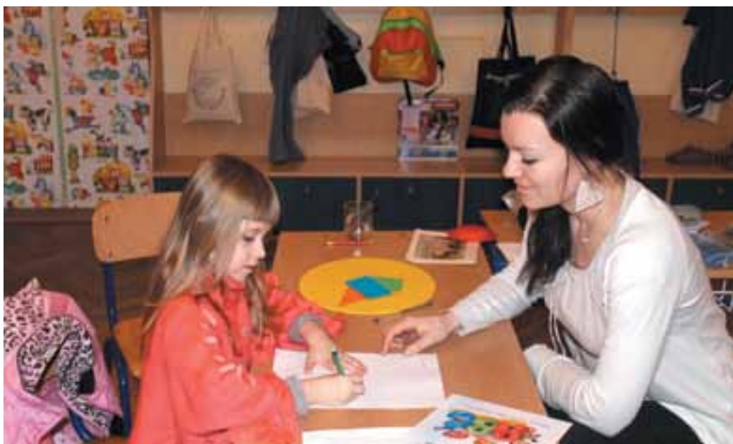
Zápis budúcich prváčikov