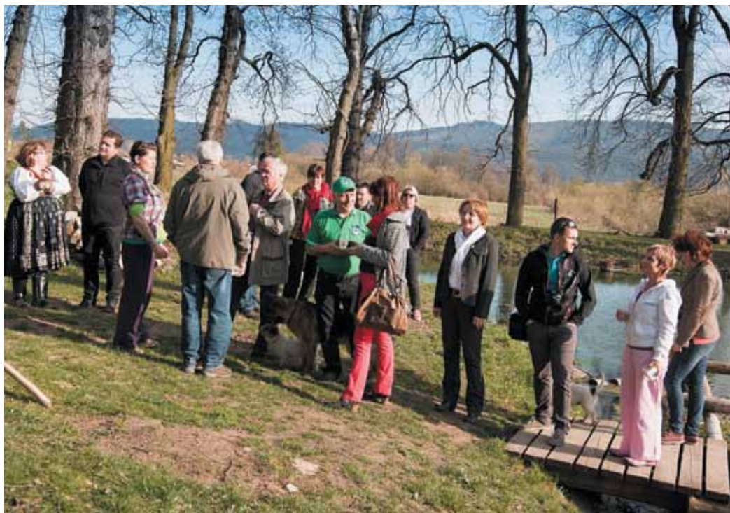
Návštevníci v Kaštieli

Železnohorský región sa nachádza v Pardubickom kraji. Krajina regiónu sa tiahne od rybníkov, malebných potokov a riek cez zvlnené podhorie s bohatým výskytom zmiešaných lesov až po vrcholky Železných hôr so svojou dominantou,