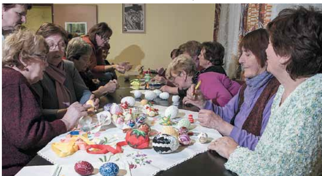
Výroba kraslic v klube dôchodcov