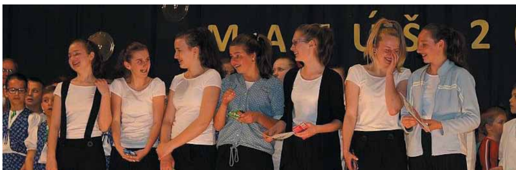
Víťazné družstvo tanečnej súťaže