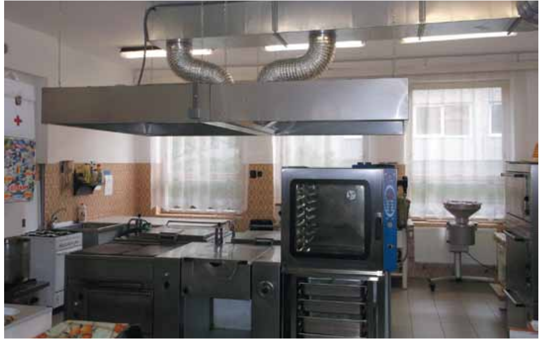
Nová vzduchotechnika