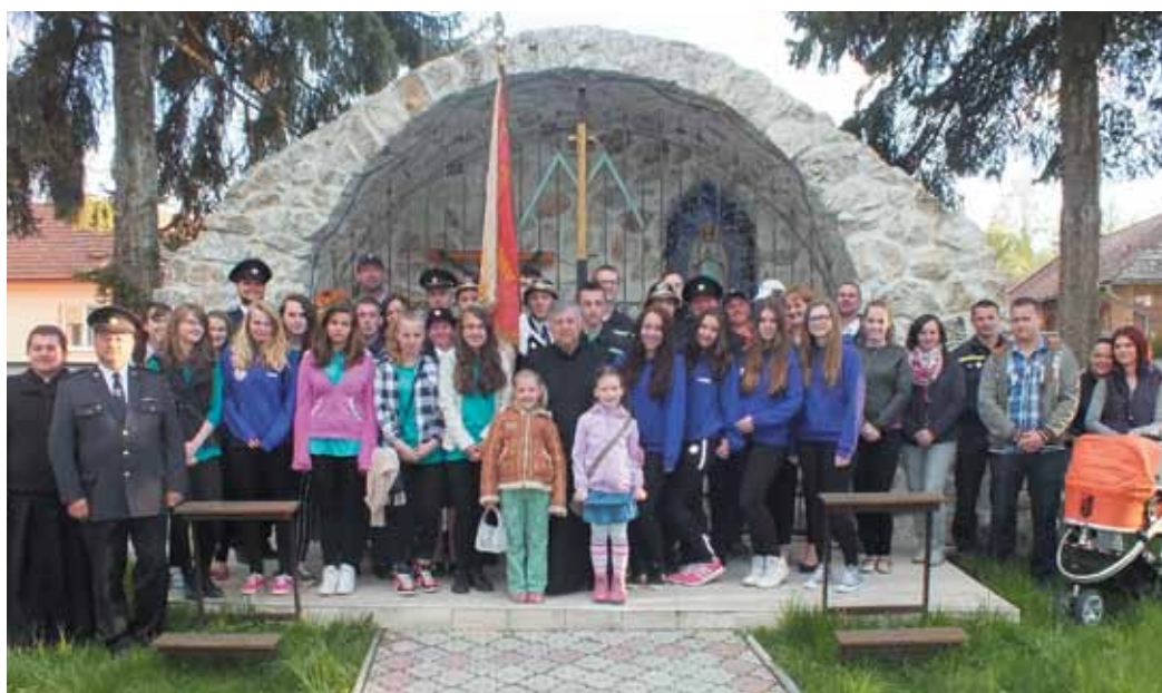
DHZ po skončení sv. omše