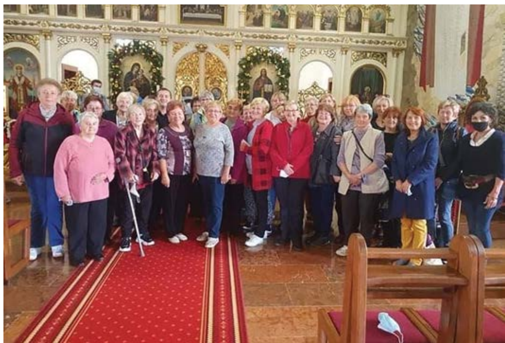
Pútnici ružencového bratstva