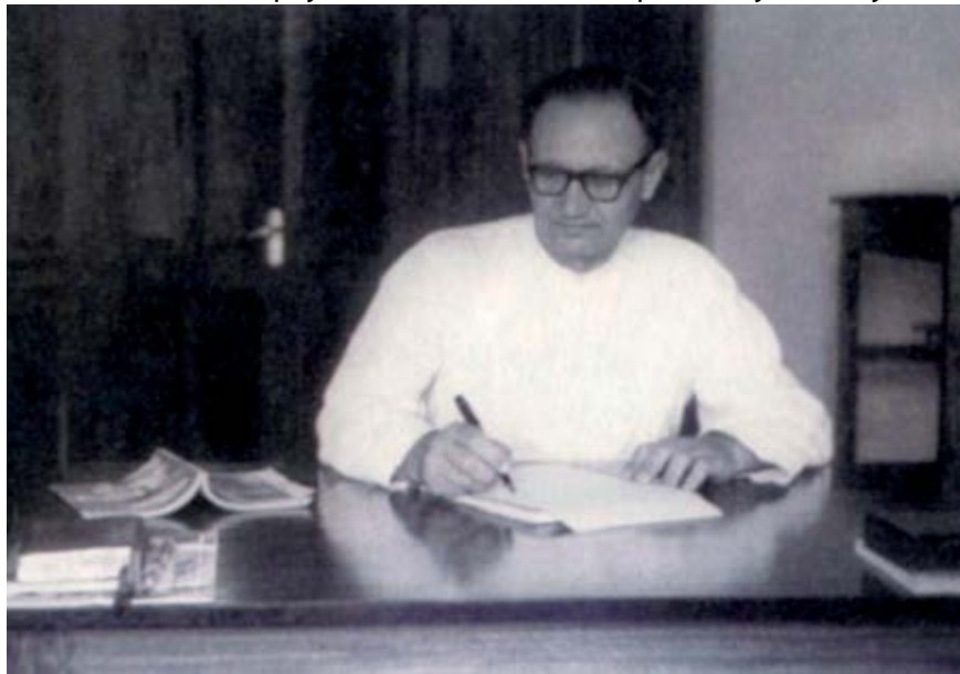
Na fare v Majhapare (zdroj kniha 40 rokov misionárom v Indii)