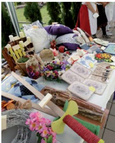
Pestrá ponuka výrobkov žiakov školy

Odborné učilište internátne , Šrobárova 20 v Poprade oslavuje v školskom roku 2021/2022 sedemdesiat rokov od svojho vzniku. Škola, ktorá mala dlhé roky svoje pôsobisko v renesančnom kaštieli v Spišskom Štiavniku, je miesto, kde sa spája skúsenosť s obavou, či oddanosť so záujmom. Škola, kde učiteľia s radosťou odovzdávajú svoju múdrosť a otvárajú žiakom náruč plnú vedomostí a srdce plné istoty. Jej bránami prešlo niekoľko generácií, ktorým sa stala druhým domovom. Poskytla im plnohodnotné vedomosti a zručnosti pre ich budúci život. Hrdo sa pýši úspechmi svojich žiakov a verí, že aj budúca generácia mladých ľudí budú jej súčasťou. 16. september 2021 sa niesol v znamení prezentácie školy na verejnosti. Pri príležitosti 70. výročia vzniku školy sme zorganizovali na školskom dvore 0. ročník školského jarmoku. Toto podujatie sa konalo aj v rámci Dní európskeho kultúrneho dedičstva. Pani riaditeľka,