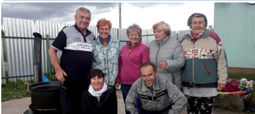
Pri guláši