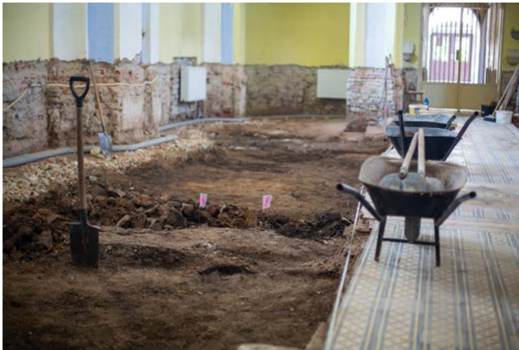
Vykopávky v kostole

sedem druhov. Najväčší celok však tvorila a aj naďalej tvorí tzv. dlažba kobercového typu. Na túto dlažbu, ako v podstate na všetko, môžeme a aj máme rôzne názory. Pamiatkový úrad nám ju nariadil zachovať v stredevej uličke a v prednej časti svätyne. Odvodnenie znelo, že aj to je časť bohatej histórie, a ak sa táto časť vyhodí, bude nenávratne preč. V ostatných častiach sme mohli realizovať nové zloženie vrstiev, ktoré nahradilo zeminu aj sedem častí pačvorkovej dlažby. Doterajšie riešenie podláh v podobe udupanej zeminu a stavebného materiálu spôsobovalo nadmerné zavlhnutie múrov, tiež aj vysokú vlhkosť priestoru kostola. Nové podlahové vrstvy tvorí násyp z penového skla, ktorý má slúžiť ako tepelná izolácia aj hydroizolácia. Na tomto ná-