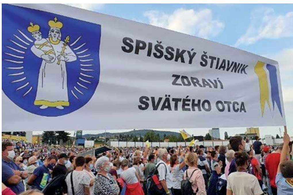
Spišský Štiavnik zdraví Svätého Otca – pútnici v Košiciach