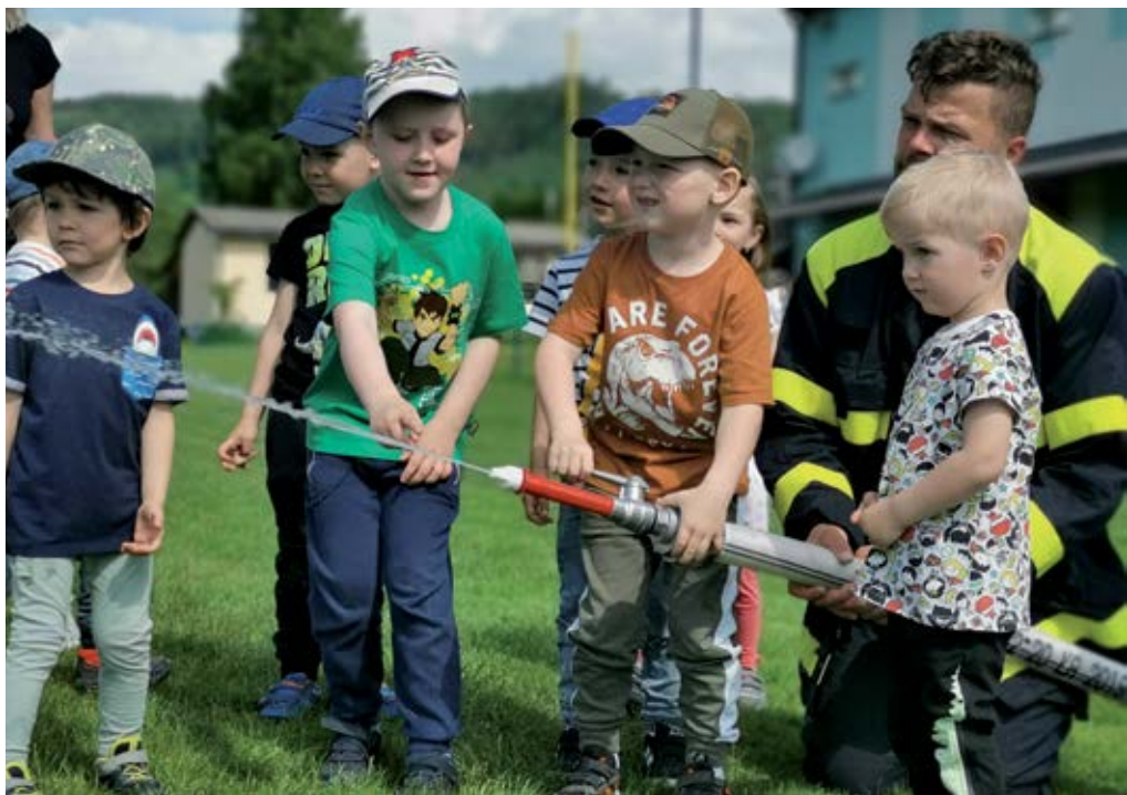
Deti s hasičmi

V júni si dobrovoľní hasiči z našej obce pripravili pre deti z materskej školy ukážku hasenia požiaru na otvorenom priestranstve. Okamžite si hrdinovia vyslúžili úžasny a dlhotrvajúci potlesk. Akcia pokračovala ukážkou hasičskej techniky, ktorú používajú pri svojej práci, ale i zdravotnickej výbavy, dýchacích prístrojov. Deti si mohli vyskúšať hasičské oblečenie, prilbu i samotné vysielacky, dokonca hadicu na hasenie ohňa. Vďaka krásnemu slnečnému počasiu videli aj dúhu, ktorú vytvorili kvapky vody. V očiach detičiek nechýbali iskierky radosti, keď nás všetkých páni hasiči pozvali v hasičských autách a spustili sirénu. Na záver sme im všetci poďakovali za inšpirujúce, poučné a zábavné dopoludnie so skvelými zážitkami! Deti dostali sladké prekvapenie ako darček od hasičov.