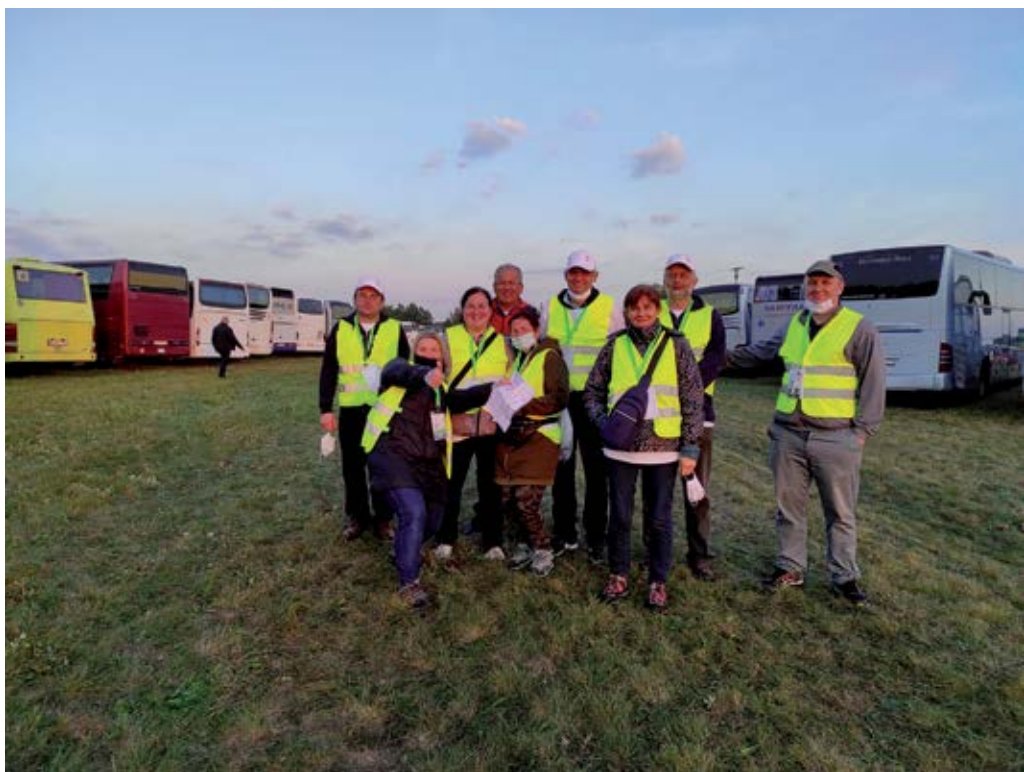
Dobrovoľní usporiadatelia v Šaštíne

zbúkovú výmenu názorov, poradu na modrom koníkovi, hejty na hlavných správach, mudrovanie pri pive a referendum. Kým sa dohodneme, neskoro. Cestou z omše na parkovisko pešiakov zastavili policajti. Nemali sme prechádzať cez cestu, kým neprejde kolóna s pápežom a ostatnými VIP. Príprava trvala pol roka, kedy kde čo a ako urobiť. Najprv debata medzi diplomaciou, potom bezpečnosť – polícia a vojaci,