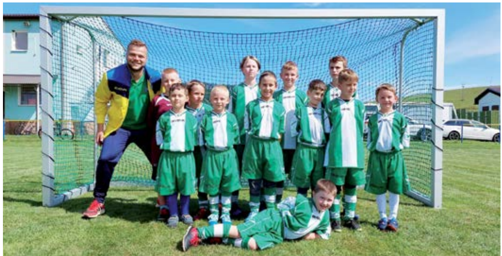
Najmladší futbalisti