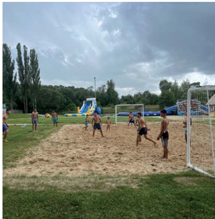
Deti v Aquaparku