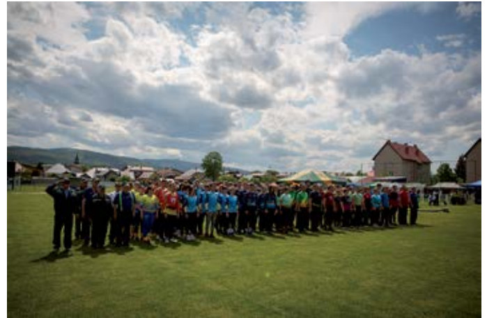
Hasičská súťaž

omladené družstvo našich chlapcov si s výborným časom vybojovalo 2. miesto a na 3.mieste skončila Hranovnica II. Poobede pokračovala súťaž družstiev dorastu a dospelých v 28. ročníku Podtatranskej