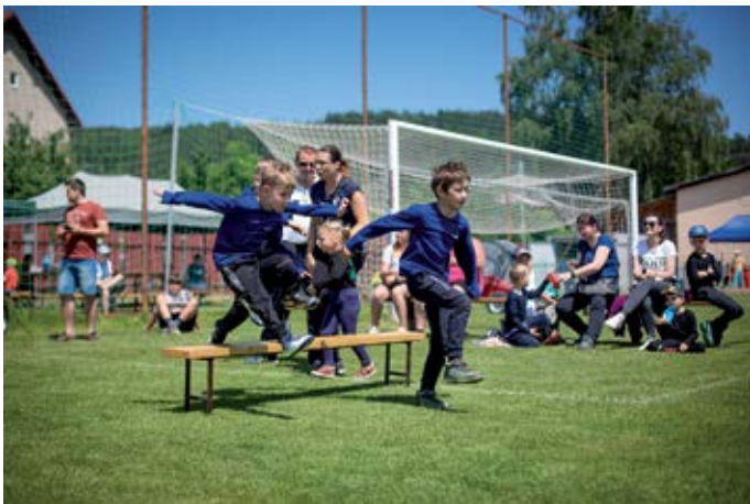
Hasičská súťaž

Súťažit' začali najmenší v kategórii Prípravka do 8 rokov, kde sa predstavilo až 23 družstiev. Vo veľkej konkurencii zvíťazili naši chlapci Spišský Štiavnik I. pred Hranovnicou a Kravanmi. Nestratili sa ani