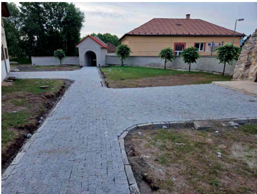
Nový chodník pri kostole