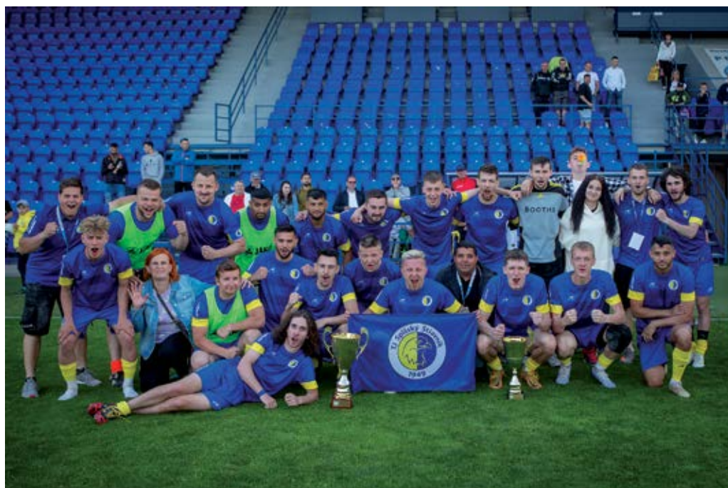
Víťazný tím