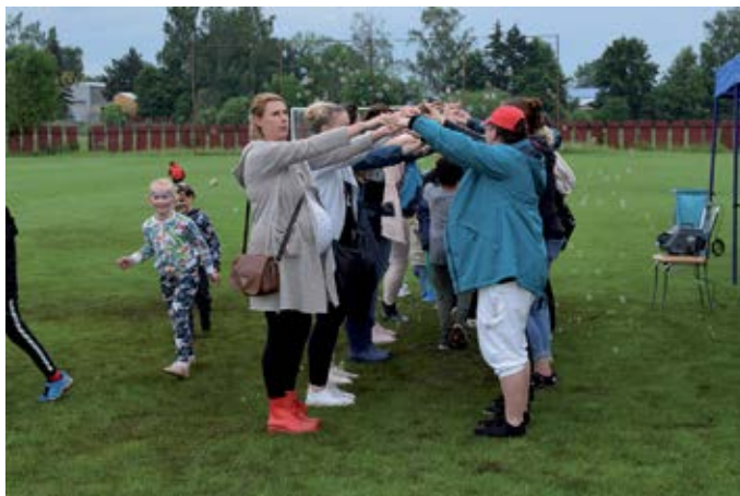
Deň vďačnosti 2023

Ďakujeme za skautov. Teda za priateľstvá, dobrodruž-