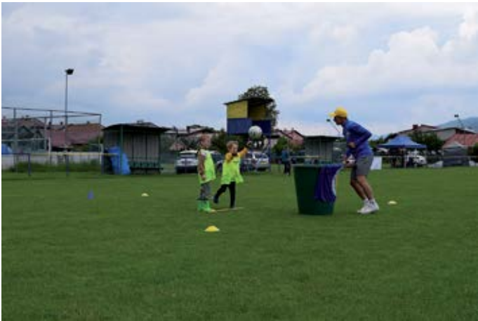
Deň vďačnosti 2023

Témou tohtoročného Dňa vďačnosti bola vďačnosť za mamu.