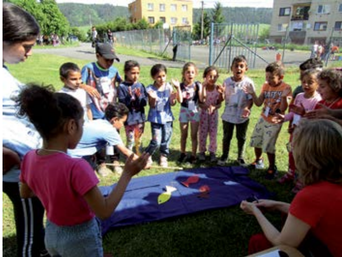
Medzinárodný deň detí.