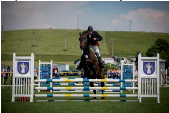
Štiavnická podkova

V mesiaci jún sa v našej obci organizujú preteky v parkúrovom skákaní o Štiavnickú podkovu. Hrátka nadšencov tohto športu, za nevyhnutnej podpory obce a sponzorov, zorganizovala v poradí už 54. ročník jazdeckých pretekov. Súťažilo sa v piatich súťažiach s rôznou výškou prekážok. Do súťaženia sa zapojilo 34 športových dvojíc z 12 jazdeckých klubov a to JO MŠK Ranč Čajka Kežmarok,