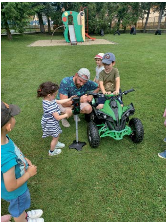
Filip a dopravná truhlica