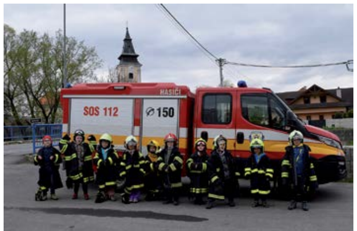
Deň otvorených dverí v hasičskej zbrojnici