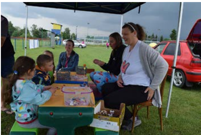
Deň vďačnosti 2023

Tak teda ďakujeme za babky. Babky vo význame staré mamy. To sú ľudia, ktorí majú pre svoje vnúčatá čas. Čas