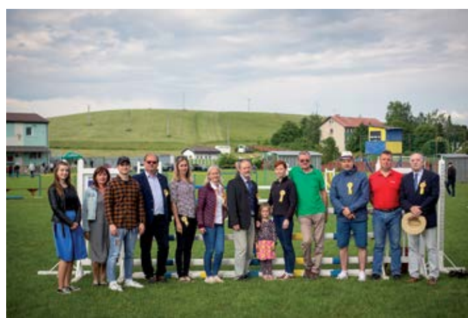
Štiavnická podkova